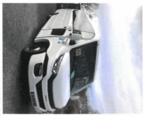
Option plateforme UFR