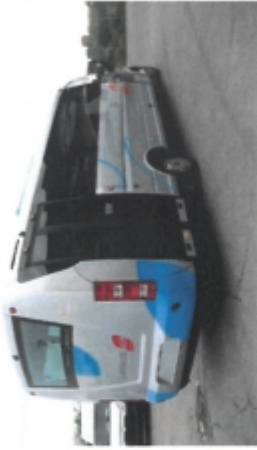
Option portique poste de conduite