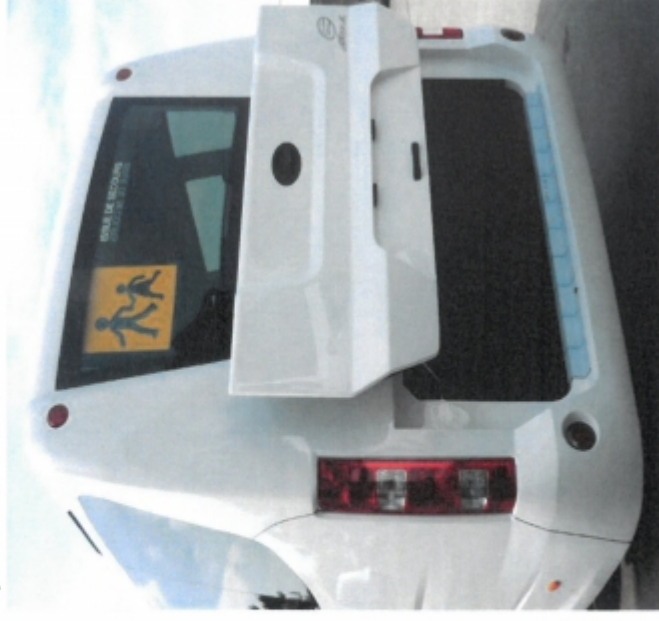
Option soute arrière